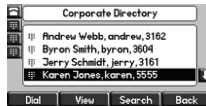
Visualize e selecione com facilidade um contato a partir de um catálogo corporativo integrado ao telefone

Este aplicativo permite que qualquer telefone SoundPoint IP conecte-se a um arquivo de dados compatível com LDAP (incluindo o Microsoft® Active Directory), que contenha todos os contatos corporativos, sem a necessidade de armazená-los em um arquivo em separado. O benefício deste recurso é eliminar a perda de tempo associada à manutenção de múltiplos catálogos. Os usuários podem buscar por nome, sobrenome ou número de telefone, e criar uma lista filtrada de contatos para visualizar, selecionar e chamar. Também pode-se optar por armazenar qualquer contato LDAP em seu catálogo de contatos locais. Como resultado, os usuários podem desfrutar de um menor tempo para conectarem-se a seus colegas e parceiros de negócios.