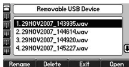
Os arquivos gravados em formato .wav podem ser reproduzidos no telefone ou em um PC

O aplicativo de Gravação Local de Chamadas suporta a maioria dos drives USB mais populares, com até 2GB de memória. Uma lista dos drives USB testados e aprovados está disponível em um boletim técnico em separado no web site de suporte da Polycom.